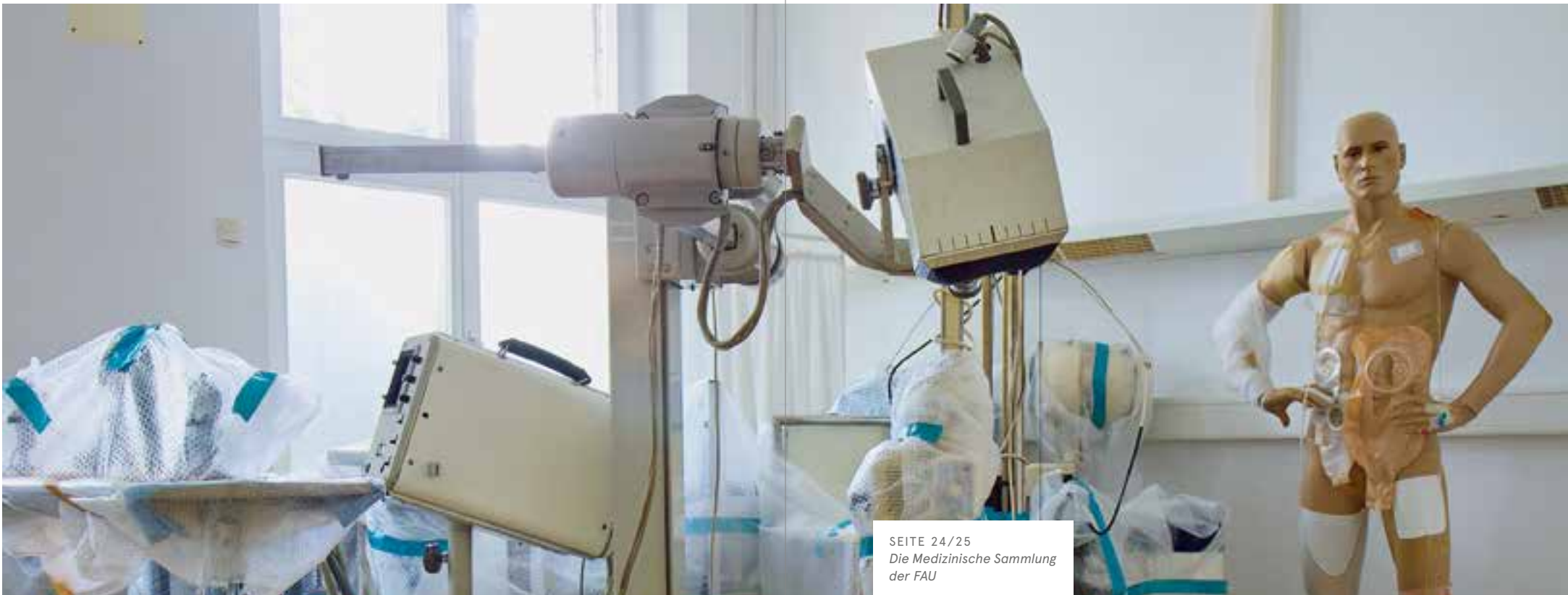
SEITE 24/25 Die Medizinische Sammlung der FAU