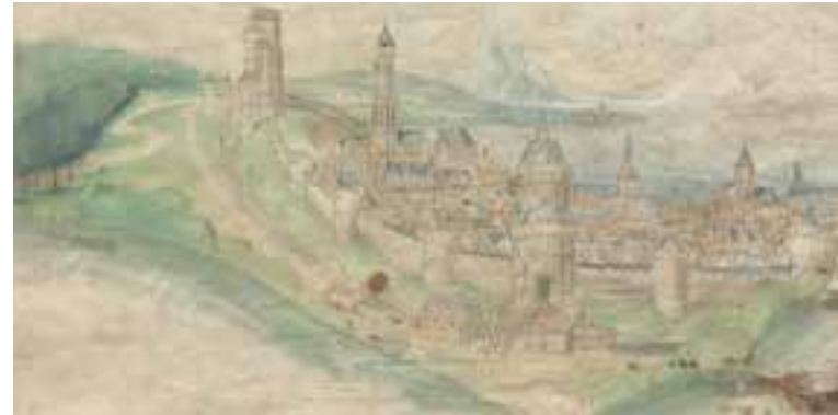
SEITE 11 Pleydenwurff, Hans (Werkstatt); Ansicht einer befestigten Stadt, nach links ansteigend, mit hohem Kirchturm links. Im Hintergrund nach rechts sich öffnendes Meer, um 1455/1460

keit, beispielsweise eine Stadtansicht von Nürnberg. Zwar können die Forscher sie keinem bestimmten Maler zuordnen, jedoch wissen sie, dass er sie zwischen 1516 und 1528 gezeichnet haben muss – darauf deuten realitätsgetreue Details an den Gebäuden hin. Somit gilt diese Zeichnung als ältestes naturgetreues Panorama Nürnbergs, das vor Ort entstanden ist.