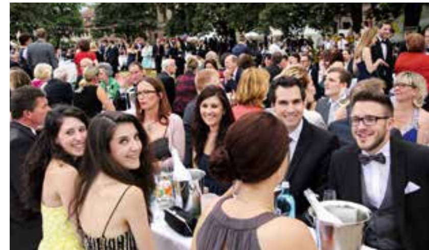
Das Erlanger Schlossgartenfest zieht jedes Jahr tausende Besucher, auch aus Politik und Wirtschaft, an.

— Auf einem der größten und schönsten Gartenfeste Europas feiern rund 6.500 Gäste zusammen bis spät in die Nacht – neben Freuden, Studierenden und Mitarbeitenden der Universität auch hochrangige Gäste aus Politik, Wirtschaft und Wissenschaft. Damit bietet das Fest eine ausgezeichnete Gelegenheit, neue Kontakte in allen wichtigen Bereichen des öffentlichen Lebens zu knüpfen – oder Geschäftspartner einzuladen –, beispielsweise an einen der Tische vor der Orangerie oder um den Brunnen vor dem Schloss: Denn Unternehmen, die Mitglied im Universitätsbund sind, können Tische reservieren und so ihren Partnern einen exklusiven Abend bieten.