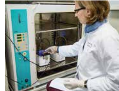
SEITE 22/23/23 UNTEN Klein, aber fein: Mit dem Live Cell Mikroskop können die Wissenschaftler die Zellbildung über längere Zeiträume hinweg beobachten.