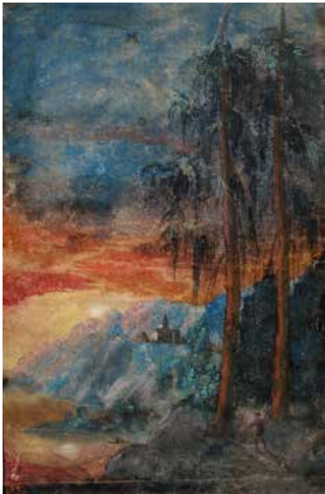
SEITE 10 Albrecht Altdorfer; Gebirgslandschaft bei Sonnenuntergang, um 1522