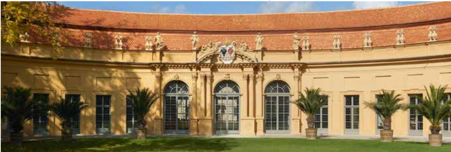
Die Orangerie im Erlanger Schlossgarten wurde vor wenigen Jahren auch mit Unterstützung des Universitätsbunds Erlangen-Nürnberg restauriert.

DER UNIVERSITÄTSBUND ERLANGEN-NÜRNBERG E.V.