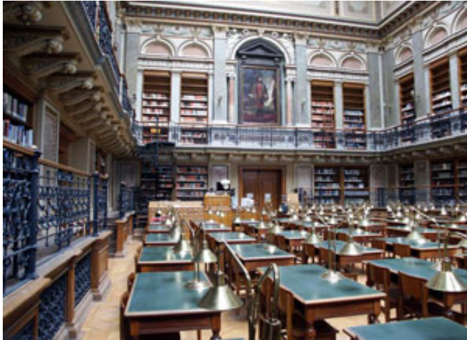
Lesesaal der Universitätsbibliothek