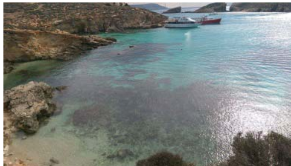
(privat Blaue Lagune)

Rückblickend kann ich es sehr empfehlen, eine Sprachreise nach Malta zu machen. Dort konnte ich meinen Wortschatz erweitern und mein Gehör für verschiedene englischsprechende Nationalitäten schulen. Darüber hinaus konnte ich auch die Grammatik verbessern.