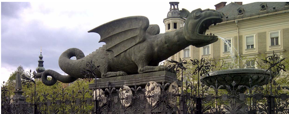
Der Lindwurm ist das Wahrzeichen der österreichischen Stadt Klagenfurt am Wörthersee und der slowenischen Hauptstadt Ljubljana (Laibach). In Orten, die Limb- oder Lind- im Namen tragen, ist oft eine Drachensage überliefert, wie beispielsweise in Limburg

Neben Stadtbesichtigung und Präsentationen über „Unikum“ und „refugees“ wurden gemeinsame Abendessen - direkt am Wörthersee und in der attraktiven Statutarstadt - genutzt, um sich untereinander und die Arbeit an den jeweiligen Universitäten besser kennen zu lernen.