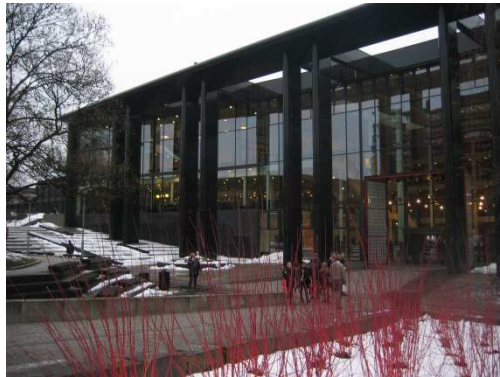
Bibliothek am Campus