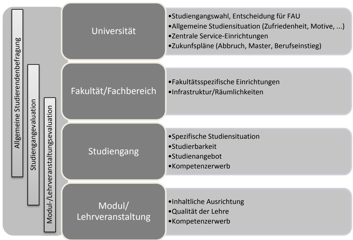
Abbildung 1: Vier-Ebenen-Modell und jeweilige Evaluationsbedarfe (Beispiele für Befragungsdaten)

Abbildung 1 zeigt die vier relevanten Ebenen der Evaluation mit jeweiligen Beispielen für spezifische Gegenstände bzw. Evaluationsbedarfe. Links sind mögliche Befragungen mit den zugehörigen auswertbaren Ebenen dargestellt. Auf der Ebene der Universität werden grundlegende Evaluationsbedarfe mit einer jährlichen Studierendenbefragung gedeckt. Hierunter fallen alle Aspekte des Studiums, die für die Fakultäten in ähnlicher Weise relevant sind. Die Möglichkeit der Berücksichtigung fakultätsspezifischer Interessen besteht nur in geringem Umfang. Entsteht hier erhöhter Bedarf können die Fakultäten eigene Evaluationen auflegen. Diese sind jedoch nicht obligatorisch und sollen nur dann eingesetzt werden, wenn über die bestehenden Datenquellen (siehe Abbildung 2) hinaus Informationsbedarf besteht oder spezifische Maßnahmen auf Fakultätsebene evaluiert werden sollen. Die Wirksamkeit ist dabei auf Fakultätsebene sicherzustellen. Die Befunde der zentralen Studierendenbefragung werden nicht nur auf universitärer Ebene ausgewertet. Auch auf Fakultäts- bzw. Fachbereichsebene und soweit möglich auf Studiengangebene werden Auswertungen der zentralen Befragungen durch das Referat L 8 zur Verfügung gestellt. Spezielle Auswertungswünsche werden jederzeit bearbeitet. Die Interpretation der Ergebnisse auf diesen Ebenen liegt bei