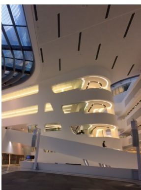
Abbildung 3: Bibliothek