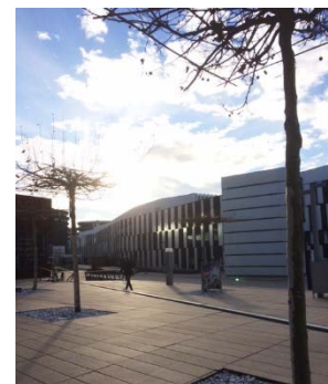
Abbildung 4: Campus

beispielsweise den Indoor-Weihnachtsmarkt „KitschMas“ besucht – der Name war freilich Programm! Dass Wien, und insbesondere das vorweihnachtliche Wien mit seiner außergewöhnlichen Weihnachtsbeleuchtung und -schmückung in der Stadt, einen Besuch wert ist, bedarf eigentlich keiner extra Anmerkung, soll aber der Vollständigkeit halber natürlich erwähnt sein.