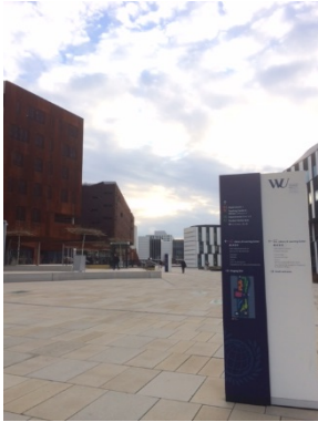
Abbildung 1: Campus der WU