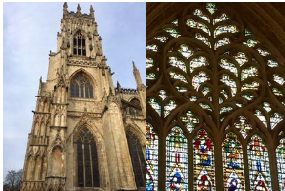
Abbildung 1: York Minster und das "Heart of Yorkshire"

Sie bietet dem Besucher neben den „Shambles“ (Yorks berühmtester malerischer Gasse, deren Namen sich von dem bis ins 19. Jahrhundert dort befindlichem Metzgerviertel „The Great Flesh Shambles“ ableitet) auch noch weitere Sehenswürdigkeiten wie z. B. das berühmte York Minster, offiziell „Cathedral and Metropolitan Church of Saint Peter in York“. Sie ist die größte mittelalterliche Kirche in England und Sitz des Erzbischofs von York. Sie wurde nach einer Bauzeit von 250 Jahren im Jahre 1472 fertiggestellt. Berühmt ist die Kirche für ihre kunstvollen Glasfenster. So findet man dort das Westfenster (1338), das wegen seines herzförmigen Maßwerks im oberen Teil auch „Heart of Yorkshire“ genannt wird.